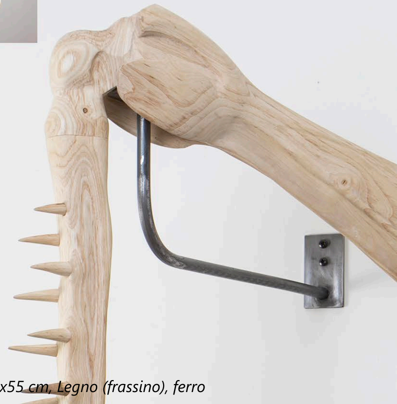
Ibridazione (cavalletta), 2020, 44x66x55 cm, Legno (frassino), ferro