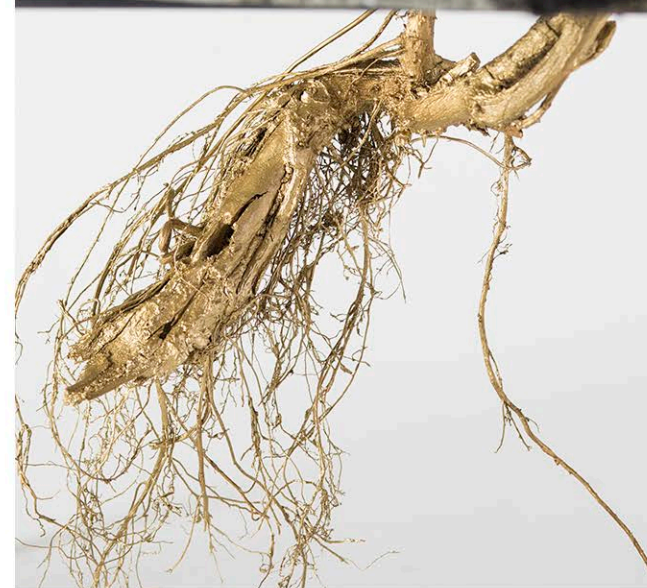
Plantae Obsistentes , 2020, 43x50x72 cm, Asfalto, ferro, legno, carta, bitume, colore acrilico