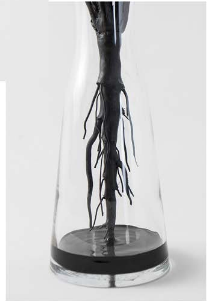
Still Life (Taraxacum nigrum) 2021, 41x54x35 cm, Poliestere (PLA), bitume, piombo, vetro