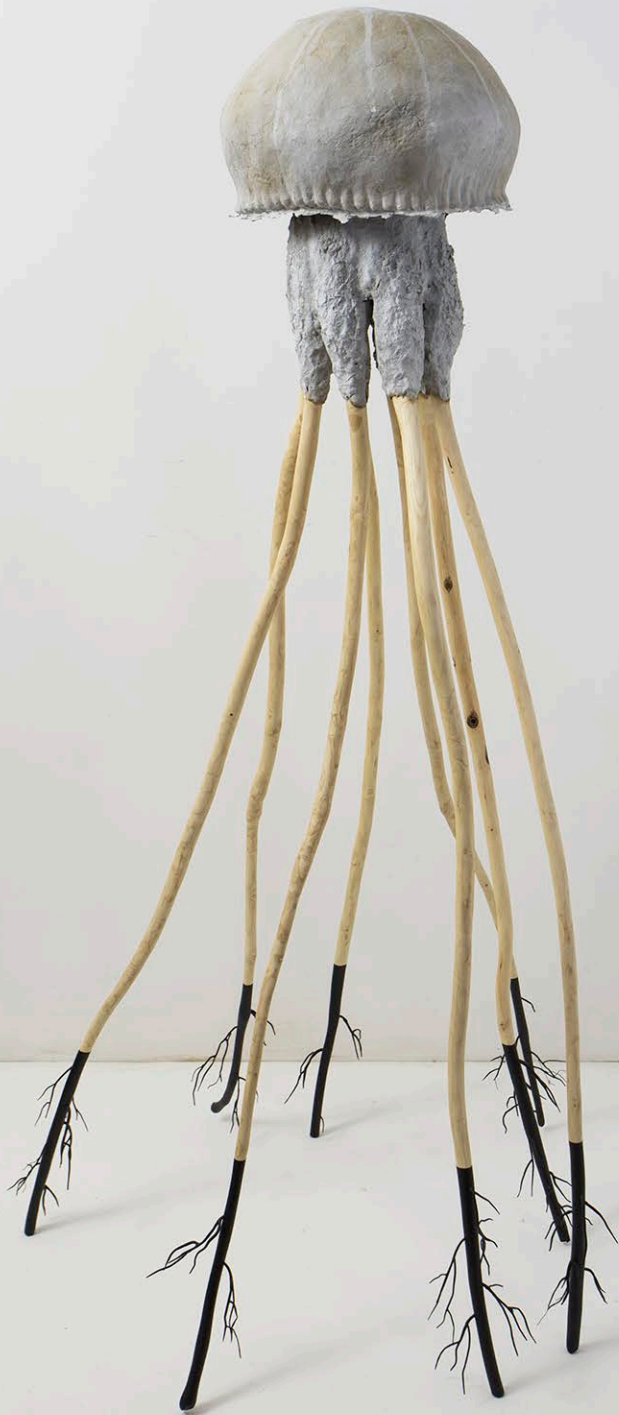
Ibridazione (Medusa), 2021, 65x75x135cm, Carta, legno, ferro, rame, colore acrilico