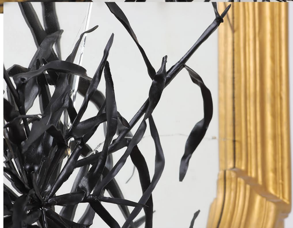
Appropriazioni #7, 2022, 55x80x15cm, Legno, specchio, poliestere, colore acrilico