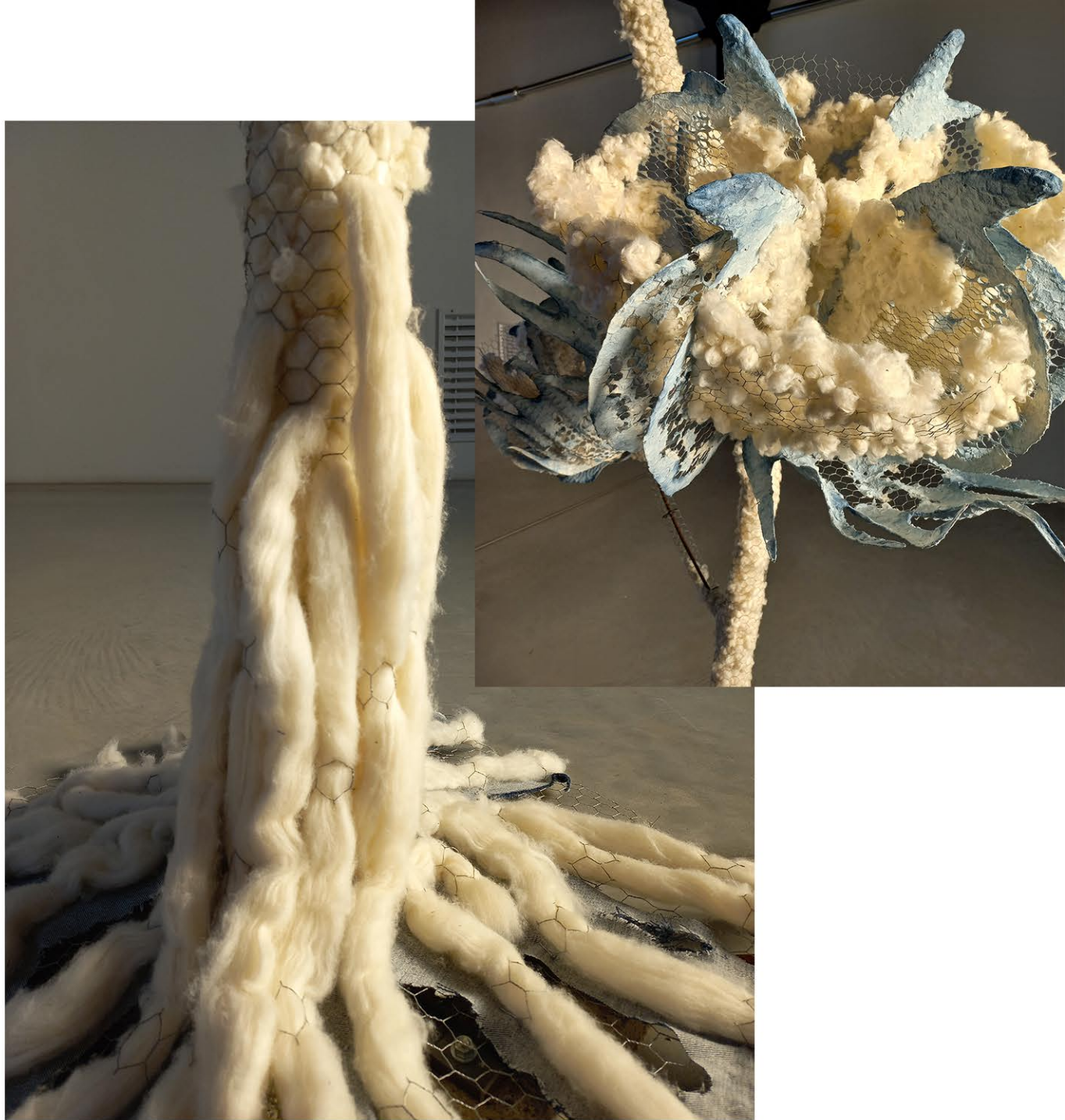
Gossypium redivivus , 2024, 300x150x150 cm Carta, ferro, cotone, cemento, colore indaco