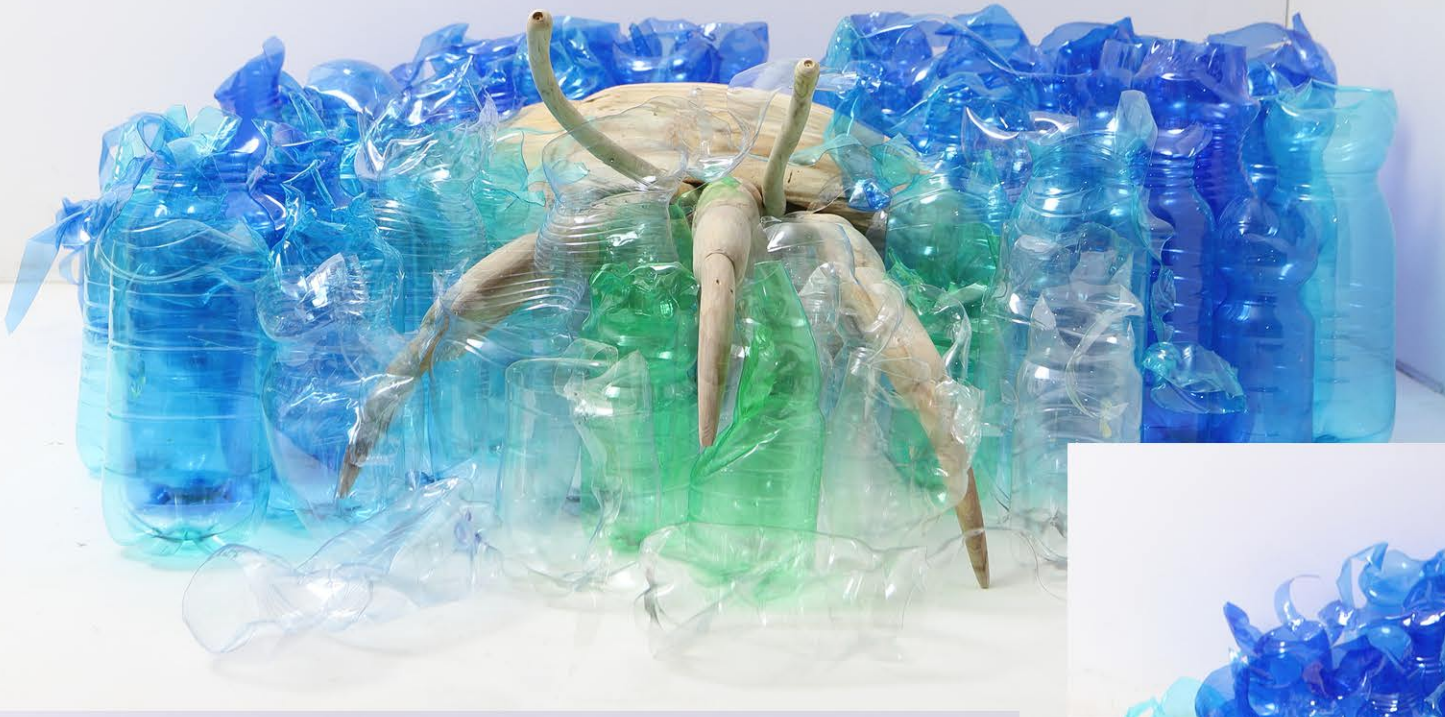
Pagurus plasticae , 2023, 100x100x30 cm Legno di betulla, plastica