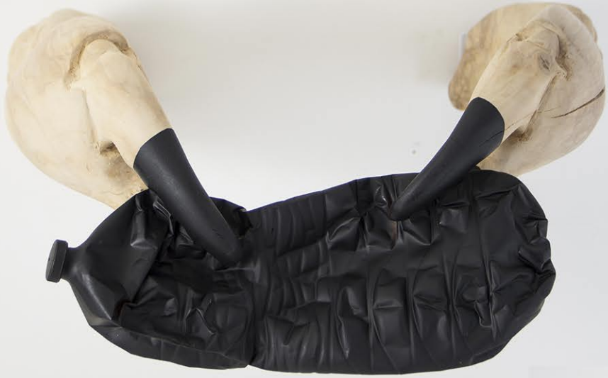
Ostensione, 2023, 50x25x38cm, Legno di betulla, plastica, bitume