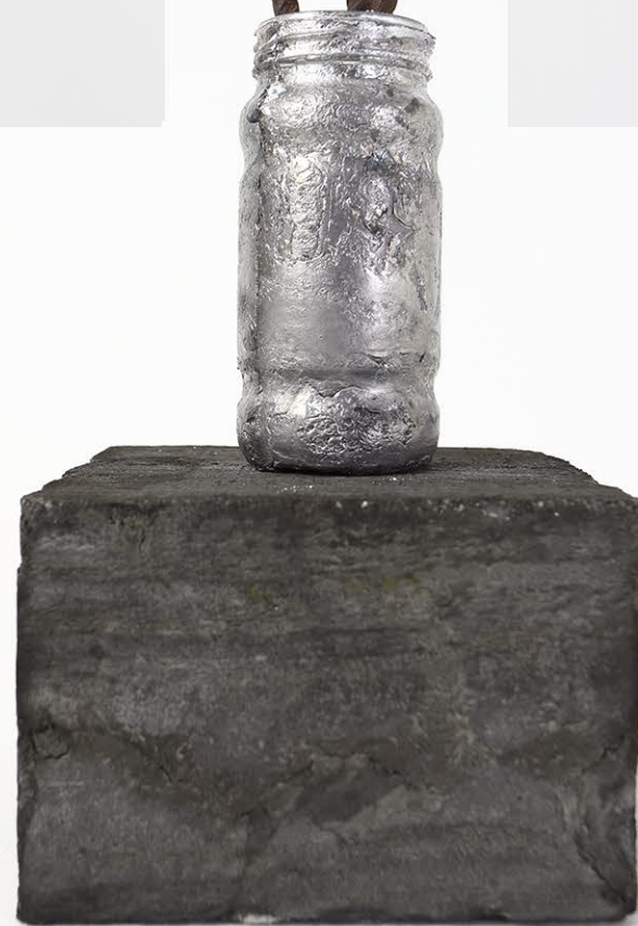
Calla concretae, 2023, 60x45x45 cm Cemento, ferro, piombo, colore acrilico