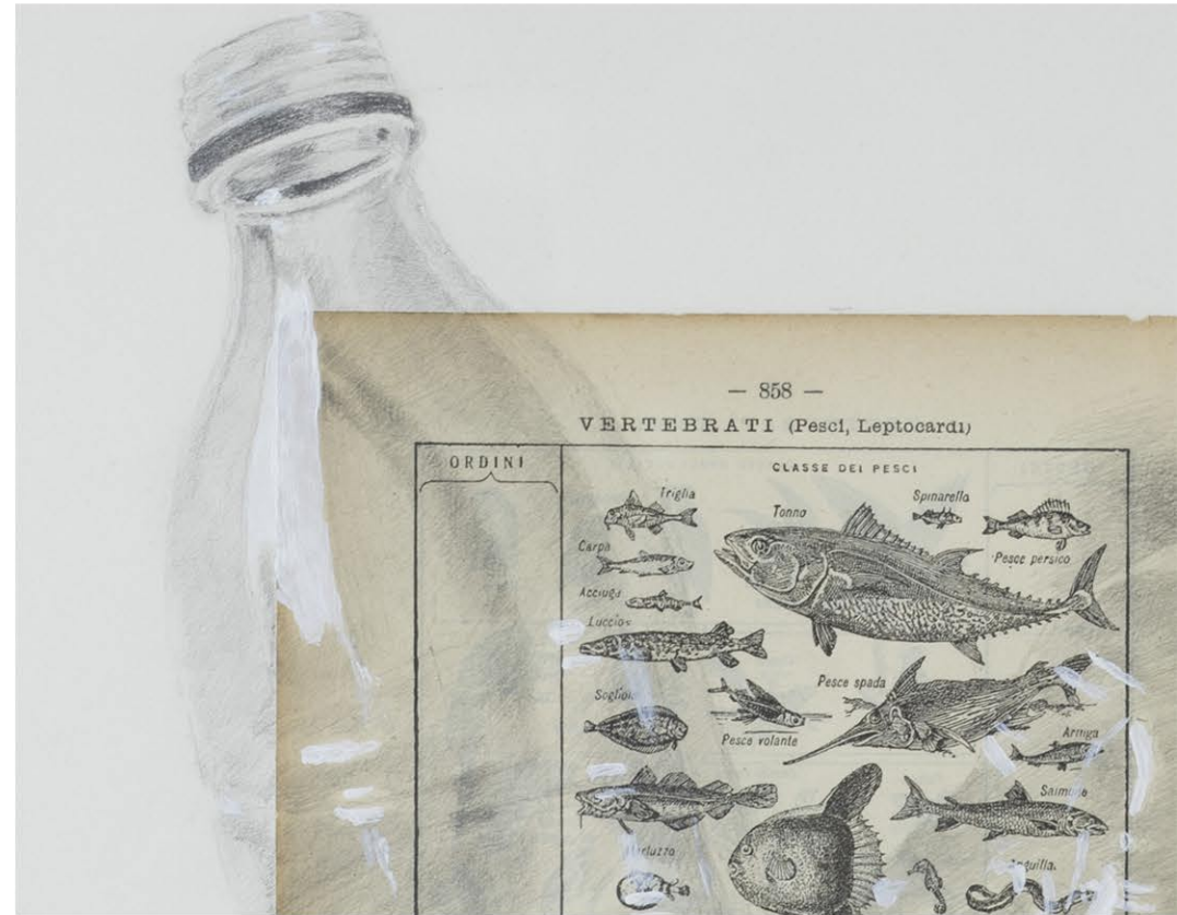
Antique Italian dictionary – Sea life, 2022, 32x42 cm Grafite su carta