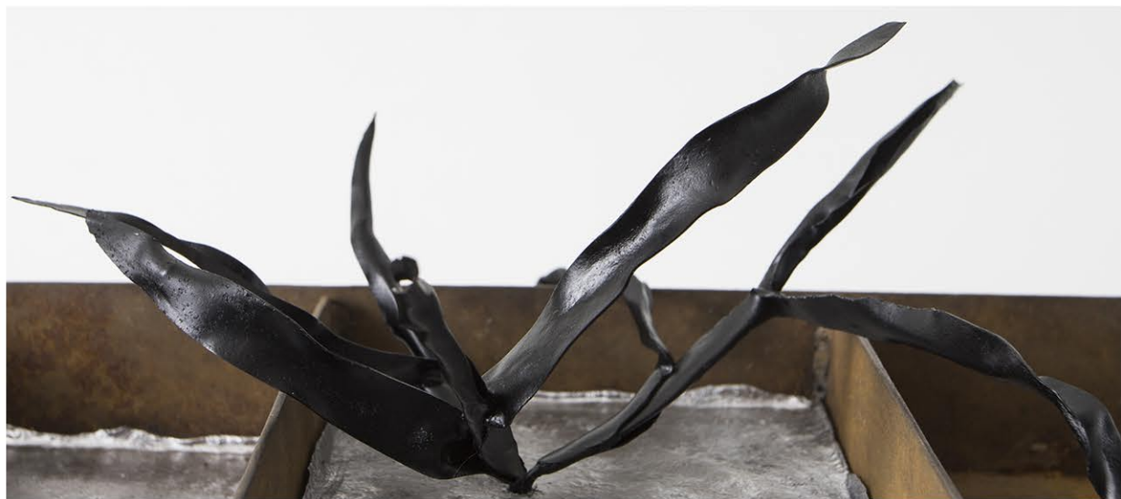
Planta plumbea, 2022, 32x21x17cm, Ferro, piombo, poliestere, cemento, colore acrilico