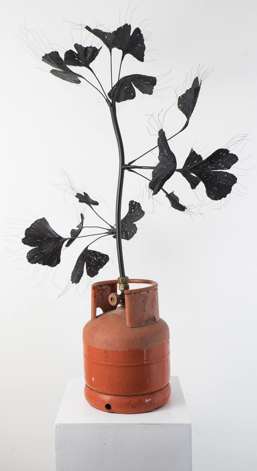
Ginkgo biloba gasosus , 2024, 50x90x45 cm PLA, rame, ferro, legno, bitume