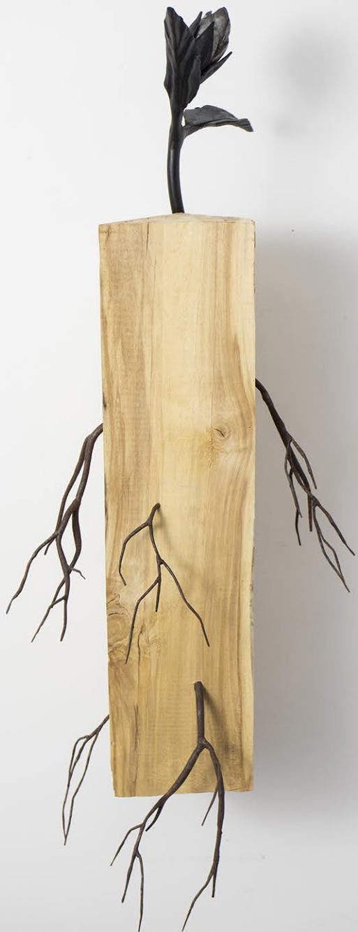
Plantă nudă, 2023, 70x28x28cm, Legno di betulla, poliester, ferro, piombo, bitume