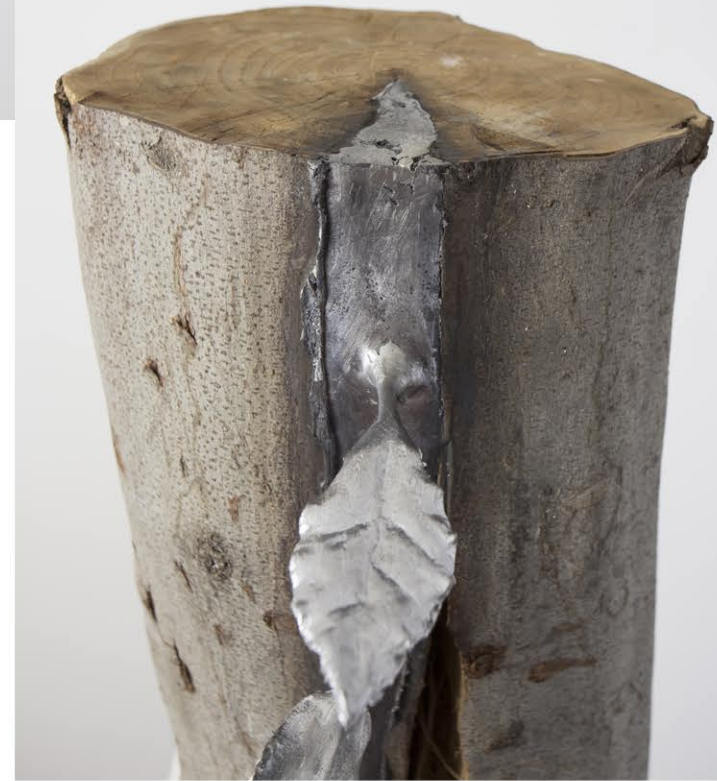
Laurus strenuus , 2023, 20x35x30 cm Legno di alloro, piombo