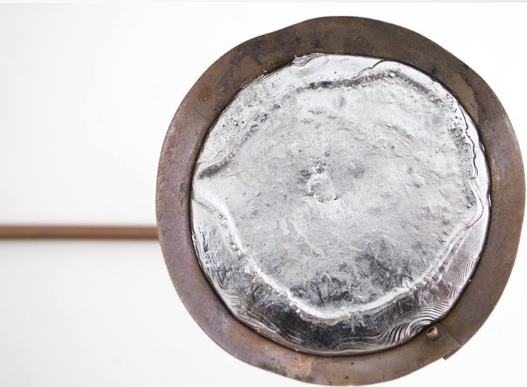
Coltura idroponica, 2024, 96x47x45 cm Rame, carta, gesso, piombo